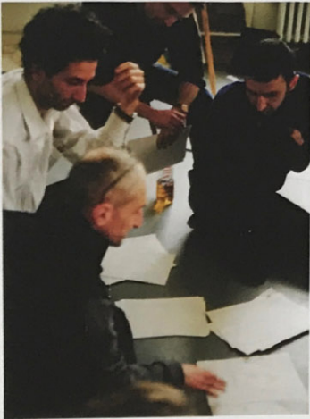
Class at Düsseldorf Art Academy