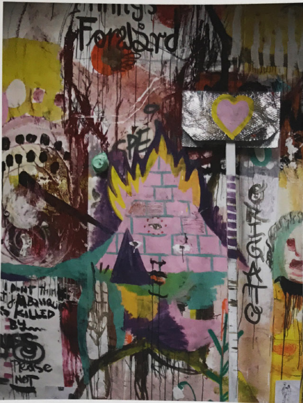
The Trojan Horse the fragments of the wall painted by the students in Alanus University as an over night action, 2008