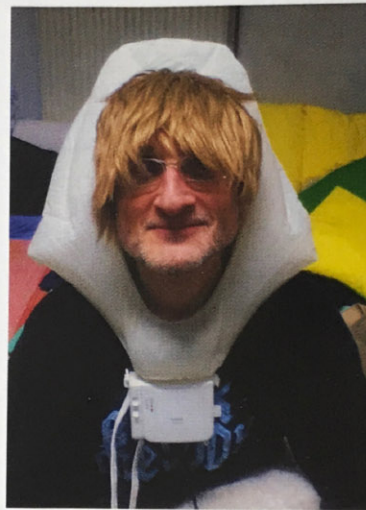
At Alanus University

Eine künstlerische Tätigkeit mit diesen Ansprüchen und dieser hohen Verantwortung erfordert den kühnen Schritt aus dem kulturellen Raum hinaus – in das Unbekannte, Unartikulierte, also Barbarische oder Absurde. Sie fordert den Sprung in den Abgrund,