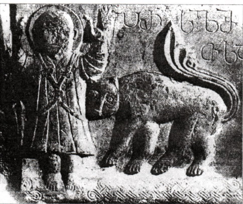
რაბათის ეკლესია, მოქაელის წარწერა ჯვრის აღმართის შესახებ (X ს.)

აღსანიშნავია, რომ მუზეუმის ტერიტორიაზე მდებარე ადრეული საუკუნეების მეთი, თივად მუზეუმის დირექტორმა ციური ლავაშმა განახლება და წარმოდგენილი ექსპოზიციის მნიშვნელოვანი ნაწილი სწორედ ამ მუზეუმში იყო წარმოდგენილი.