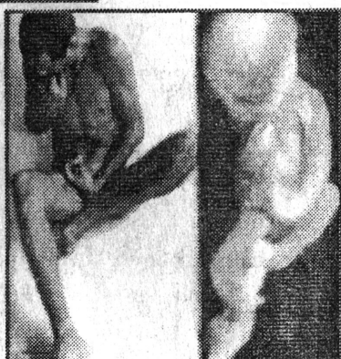
Art Photography Basso Shonhardt

შემდეგ, მახო ნიკოლაძის მიერ მოეწყო ახალგაზრდებთან შეხვედრა. შეხვედრას თან ერთოდა ელექტრონული მუსიკა, ბოლოს კი დისკოთეკა. ამას მოჰყვა ლია შევლიძის ნახატების გამოფენა. მალევე შედგა გუგა კოტეტიშვილის გამოფენის გახსნა, სადაც ძველი კინოაფიშები იყო წარმოდგენილი. როგორც თავად ორგანიზატორებმა გვითხრეს, ამ საღამოზე, ფაქტობრივად, კლუბი „სარდაფის“ ახლებური წარმოჩენა მოხდა. დეკემბრის მი-